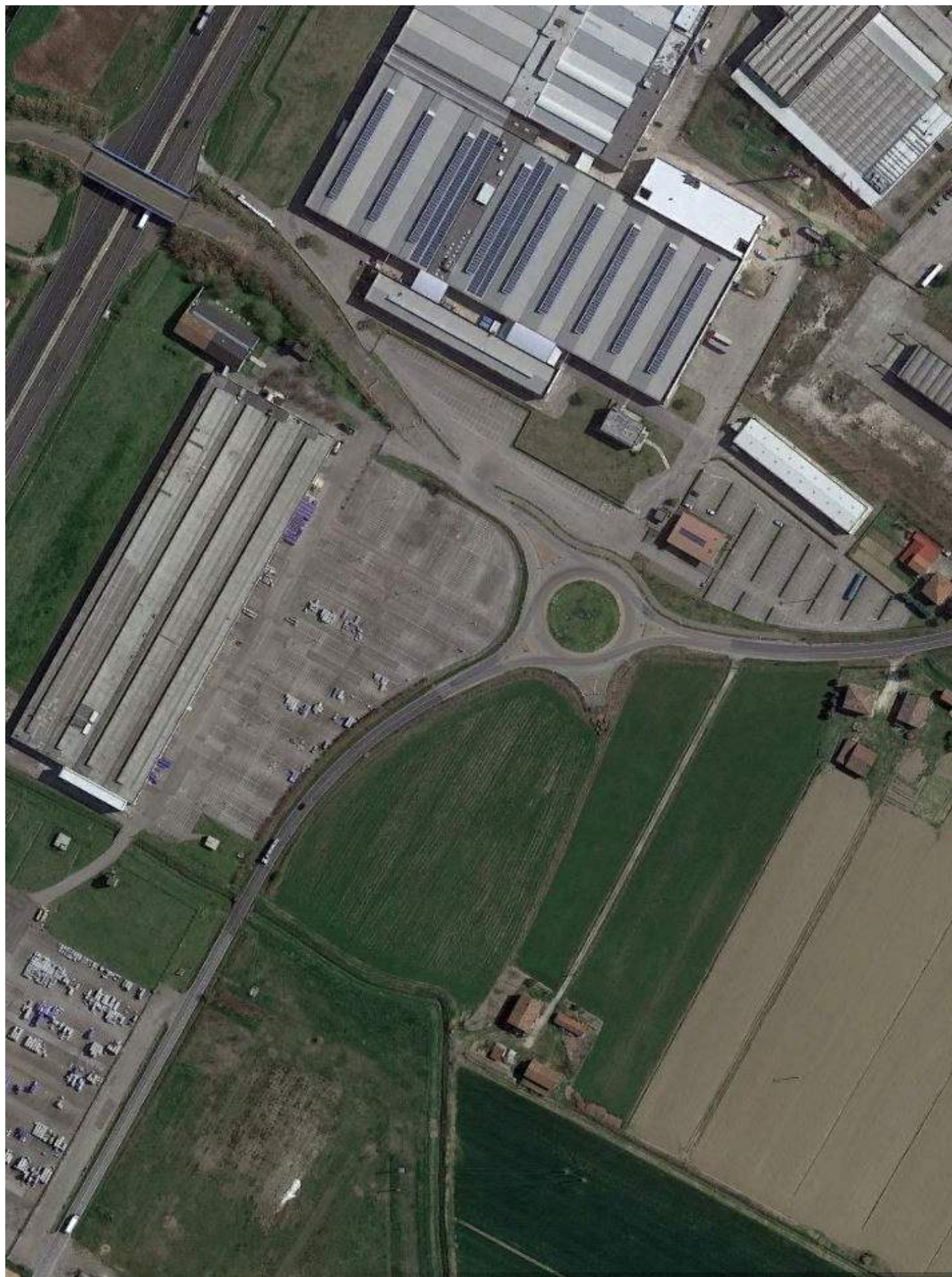
Inquadramento territoriale – foto aerea